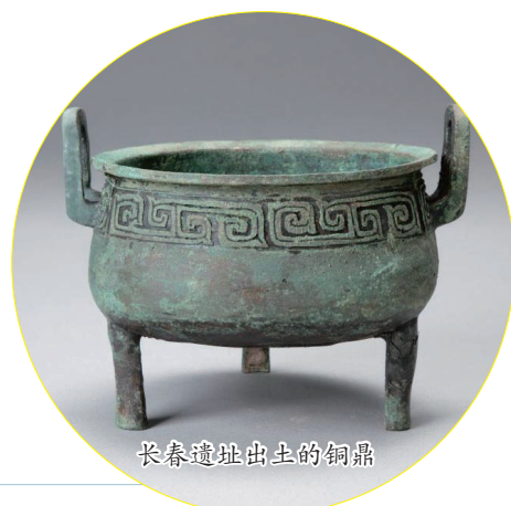
长春遗址出土的铜鼎