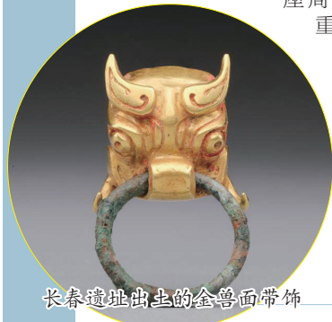
长春遗址出土的金兽面带饰